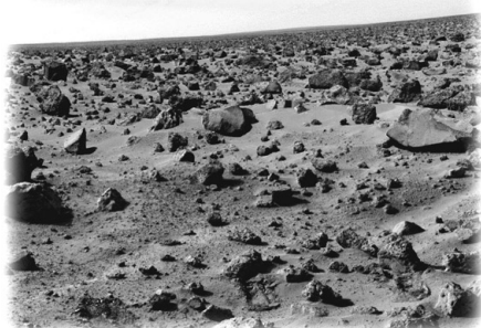
Mars, taget senare

För oss som har levt med Pappas födelsedag sedan april känns kvällen utdragen, åtminstone gör det det för mig. Så vi drar oss tillbaka ned till oss, ner till Barnens hus, där vi får vara ifred. Nästan påskyndade av Pappa. Hans ansikte är litet flammigt nu, och så fort vi ungdomar har försvunnit behöver de vuxna inte hålla någon allvarlig fasad längre. I detsamma som vi är ute genom dörren presenterar Pappa ytterligare en flaska med något hemkryddat för de redan vältankade gästerna. Nu är det ganska mörkt, åtminstone för att vara i juli,